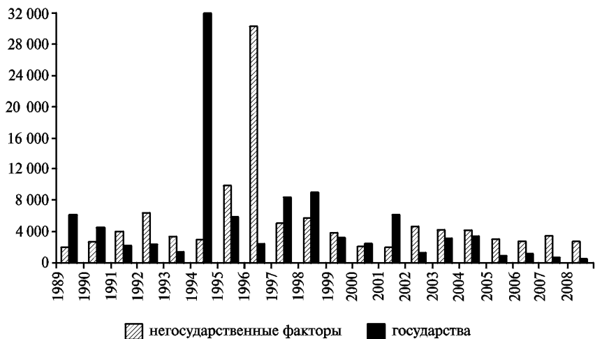
Рис. 2. Число убитых в результате одностороннего насилия со стороны государств и негосударственных акторов, 1989—2008 гг.

действий между комбатантами (в том числе от партизанских атак по военным объектам противника), а с другой — объясняет, почему терроризм так тесно связан с вооруженными конфликтами и наиболее часто применяется именно в контексте вооруженных конфликтов .