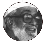
1986-1996 Мухаммад Хамид Абу аль-Наср