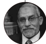
с 2010 Мохаммад Бадиа