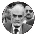
1996-2002 Мустафа Машур