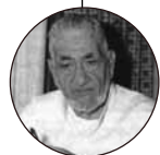
1972-1986 Омар аль-Тильмисани